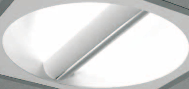
SCOUP 500 BAC