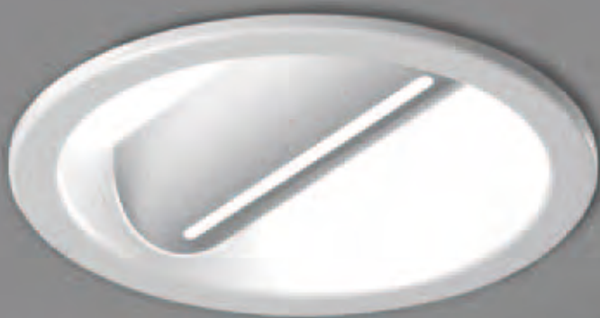
SCOUP 200 CO