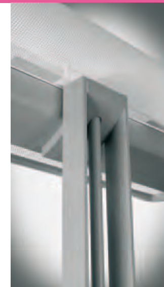
TÊTE DE PETALE DÉTAIL DE FIXATION ARRIÈRE