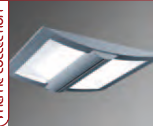
EGAL 600 PAGE 85