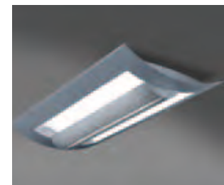
EGAL 750-1350 86-87