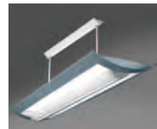
EGAL-S 1350 PAGE 104