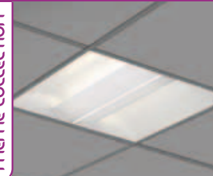
EBIND 600 PF PAGE 32