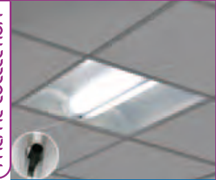
EBIND 600 HR PAGE 35