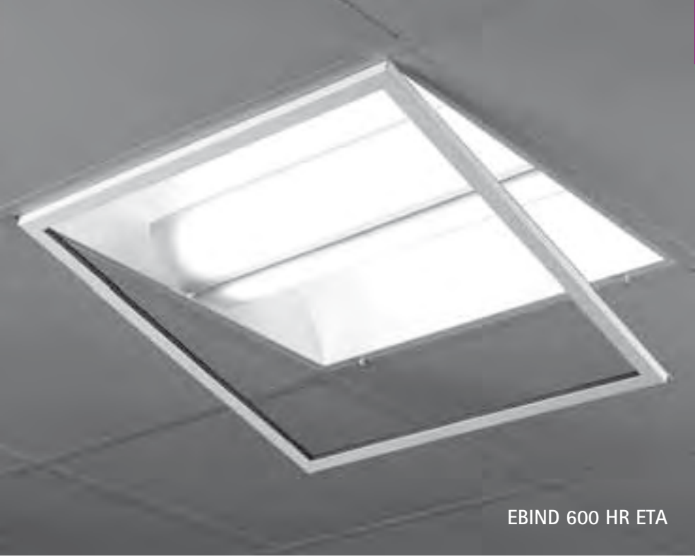
EBIND 600 HR ETA

Encastré pour 2 lampes fluo-compactes 34, 36, 40 ou 55W Portières en polycarbonate diffusant à Haut Rendement photométrique (HR) ou Portières d'aluminium extrudé laqué blanc (CO) Étanche par le dessous Cadre d'acier basculant avec verre clair trempé Caisson avec ouïes de ventilation