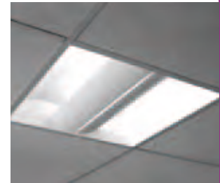
EBIND 600 CO PAGE 36