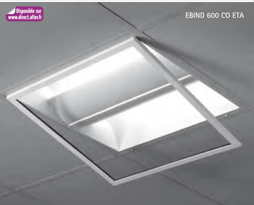
EBIND 600 CO ETA