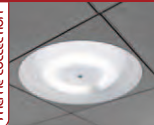
SKY PAGE 67