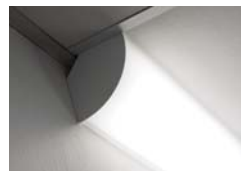
Pose en angle