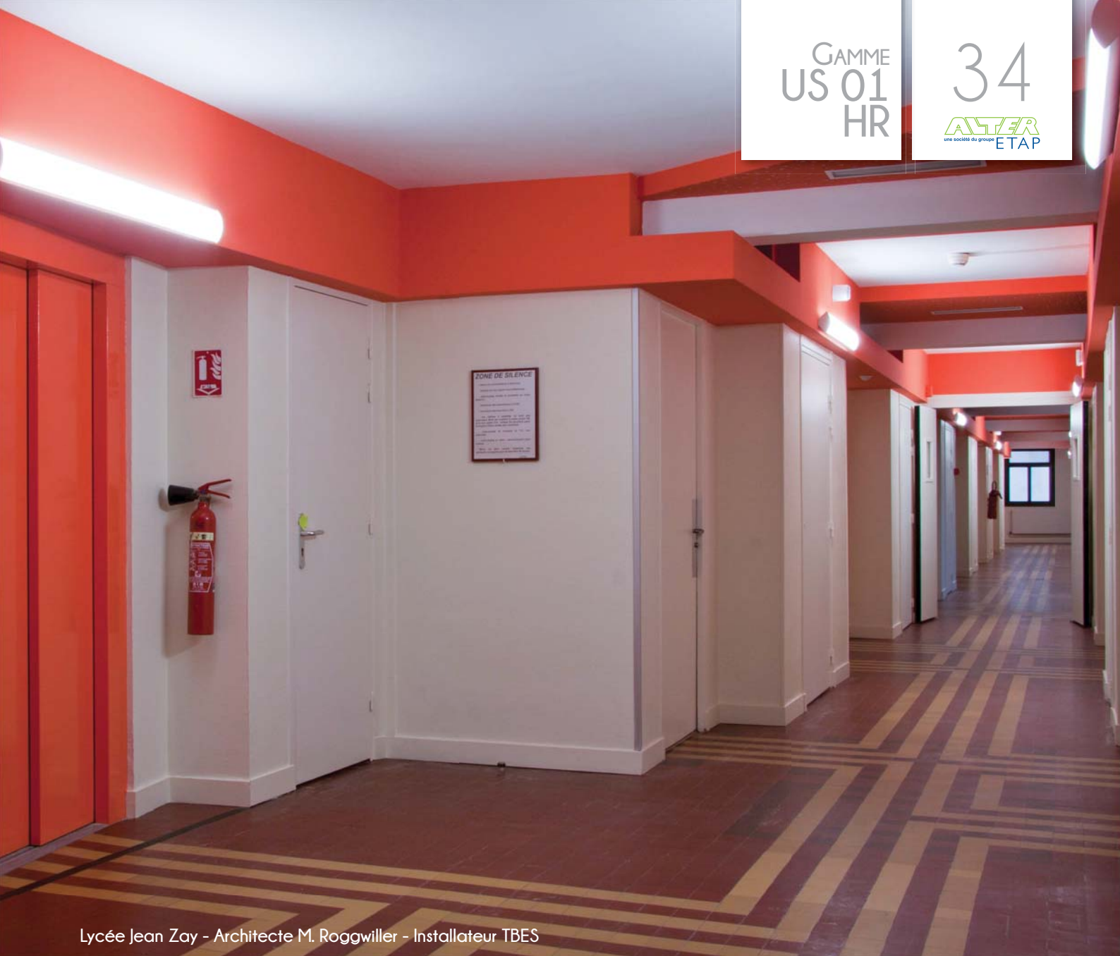
Lycée Jean Zay - Architecte M. Roggwiller - Installateur TBES

Applique ou plafonnier pour un tube fluoescnt T5 14, 21, 28 ou 35W 4 longueurs possibles : 600, 900, 1200 ou 1500mm Sa géométrie permet une fixation au mur à plat ou en angle Réflecteur en tôle d'acier laquée blanc 4 Diffusant en polycarbonate Haut Rendement