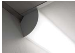
Pose en angle possible